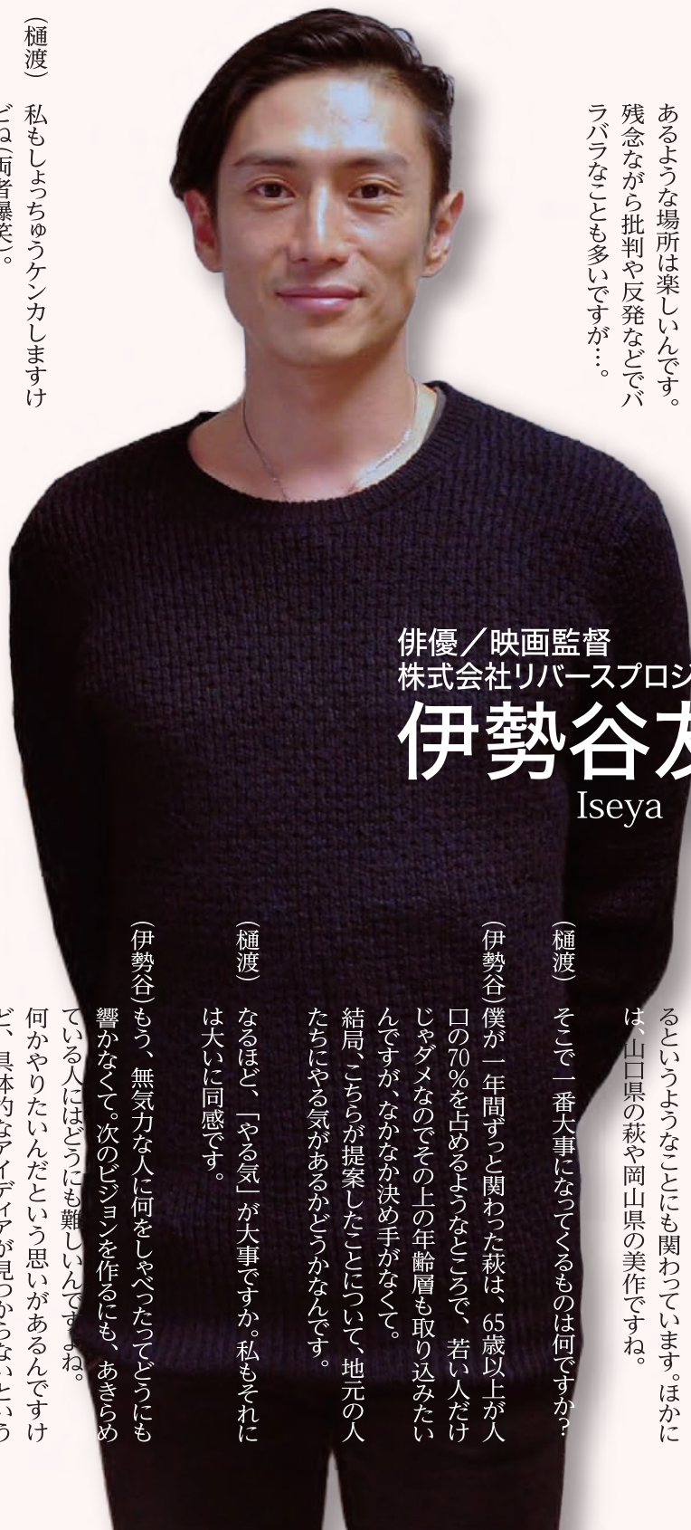
俳優／映画監督 株式会社リバープロジェクト代表 伊勢谷 友介 Iseya Yusuke