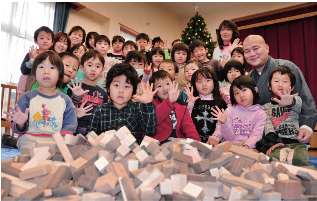
▲「陸前高田のおともだち、楽しく遊んでね!!」(写真はあさひ保育園で撮影)

ただいた家具の切端木材を使い、各園の保育士や園児・保護者がやりなど加工して作ったものです。平成24年9月に、同部会は陸前高田市の保育園会を訪ねて交流を