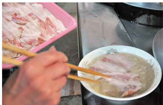
▲自家製チャーシューは、豚バラ肉の薄切りを使用 スープとの相性にこだわって、しょう油だけで炊く