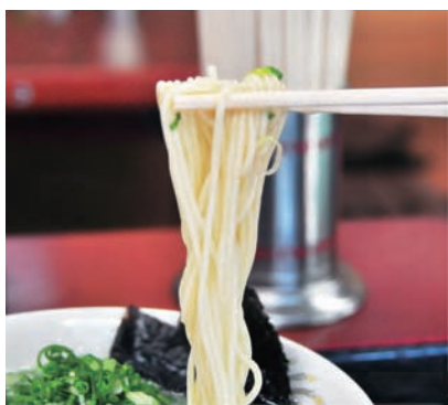
▲ストレートの細麺にスープが絶妙に からむ。地元では絶大な支持を得る

山内町の契約農家から仕入れる 新鮮なネギも、アクセントとして効 いている。シンプルゆえにごまかしが きかない、それだけに味にとんこつ こだわった一杯を堪能した。