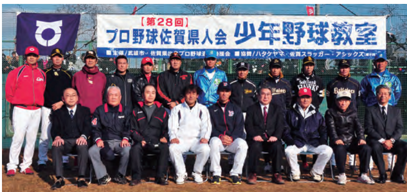
▲ズラリそろった豪華な顔ぶれに野球少年たちも大喜び