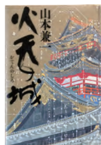
『火天の城』 山本 兼一 / 著 文藝春秋

くさは・みさこ ◆武雄市図書館選書委員。地図を片手にしたウォーキングやローカル線のバス旅行などが趣味。今は「数独」に熱中している。