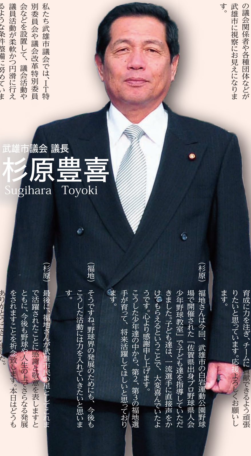
武雄市議会 議長 杉原豊喜 Sugihara Toyoki