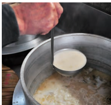
▲とんこつスープは、豚の頭のみを使っ た白濁タイプ。濃厚だが、後口はすっきり

しかし奥さんは、「有名人だ からと特別なことはしません。 自分の店のいつものラーメンを 出すだけです」と言う。その言 葉には、来久軒のラーメンに対 する確かな自信と誇りが感じ られた。