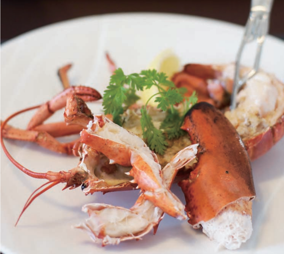
▲オマール海老も、たけお茶寮の看板料理。鮮度抜群のものを厳選して提供している。