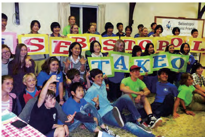
▲昭和60年から続くセバストポール市との交流。これまで、世界に目を向ける若者たちを数多く輩出してきました。