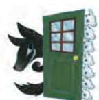
おおかみと7ひきの子やぎ