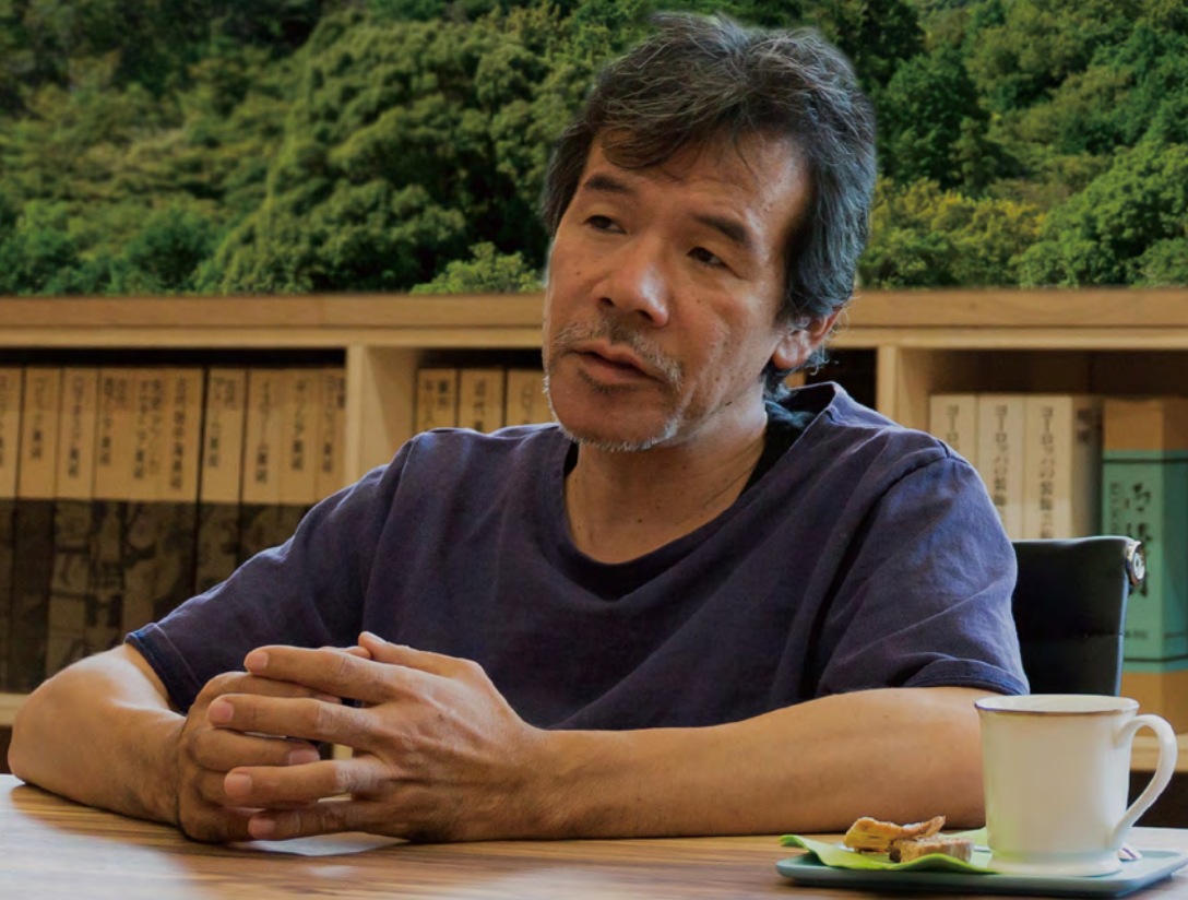
ドイツの名高い芸術家集団「マイセン陶磁」、フィンランドの芸術先進地域「フィスカス村」など、葉山さんは世界を知り、自らが理想とするこれからの芸術の在り方を実現しようとしている。