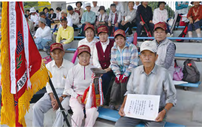
総合優勝は「山内町大野チーム」

平成26年度武雄市老人スポーツ大会が開催され、32チーム、総勢224名が参加し、グラウンドゴルフが行われました。会場となった白岩競技場を駆け巡りながら、参加者の皆さんはおよそ半日の大会終了まで活気に満ちていました。ホールインワンをされた方からは若者のように大きな歓喜の声も！今日の武雄の活力は、このような元気な方々が大勢いらっしやるからこそです！若者たちも負けていられませぬ。スポーツの秋です、適度に運動をし、健康を維持していきましょう！