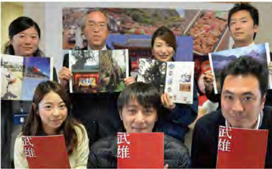
観光パンフレットは市役所、観光協会にてご覧頂けます。 ダウンロードはこちらから http://www.city.takeo.lg.jp/kanko/pamphimg/rednavi.pdf

これから武雄を訪れる方のみならず、武雄市民にとっても、この街の魅力を再発見できる、このような魅力的な観光パンフレットがあることは誇らしいことです。