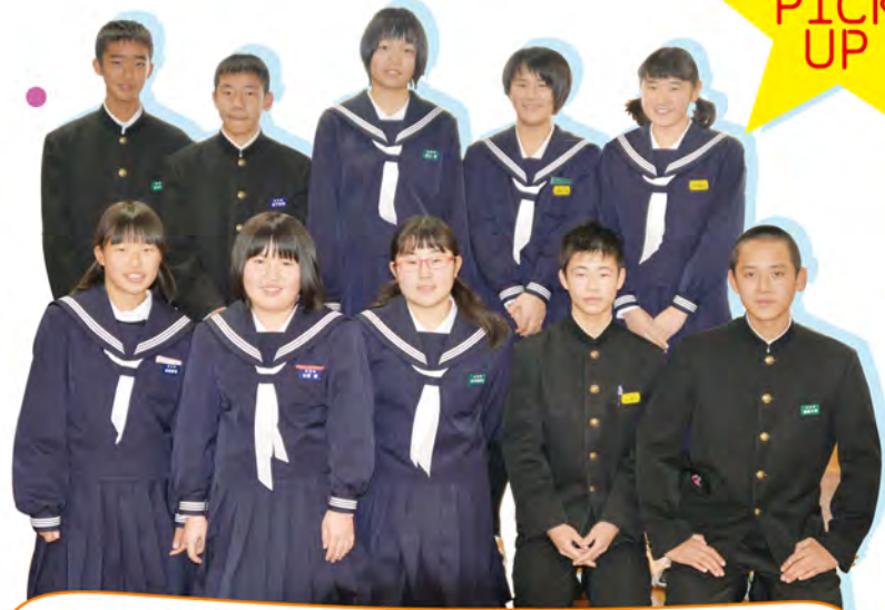
★ 北方中学校 東日本大震災被災地視察研修 報告団