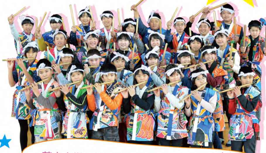
★ 若木小学校5・6年生 若木大楠太鼓「諧」

★ 今年は6年生の太鼓に加え、5年生も篠笛で仲間入り。小さな手と体いっぱい演奏される子ども達の集大成を、ぜひ楽しみにしてほしい。