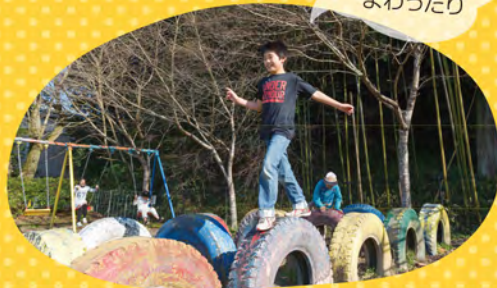
元気に走りまわったり