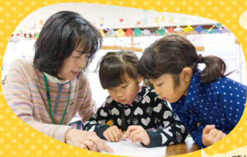
お部屋で遊んだり

1人月額3,000円。 同一世帯の2人目は1,500円、 三人目～無料。 （制度拡充に伴いH28年4月より改定）