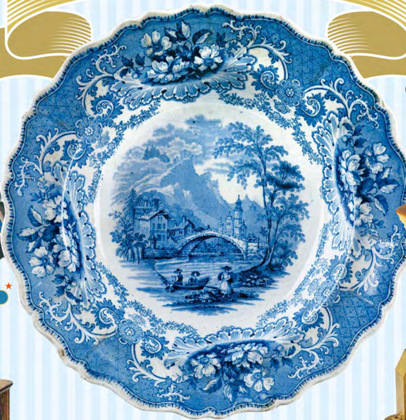
イギリス焼物(染付西洋風景図桜花深皿)★