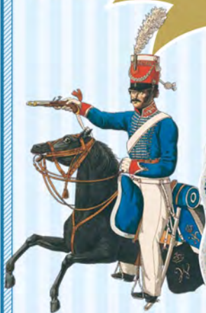
トッペンズ「オランダ陸軍の服装と武装」★