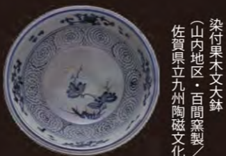
染付果木文大鉢 (山内地区・百間窯製) 佐賀県立九州陶磁文化館蔵

染付鷺羽根文皿 (佐賀県立九州陶磁文化館/柴田夫妻コレクション) (ぞめつけさぎはねもんざら) 1630～40年代の作品で、口径15.1cm、高さ2.6cm。白地の素地に呉須(酸化コバルト)を用いて下絵付けを施し、さらにガラス質の透明釉をかけて焼き、文様を藍色に発色させた、磁器に多く見られる染付の技法を使っている。