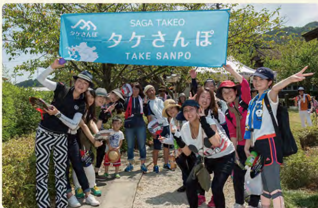
8月は「タケさんぽ」若木コースに22名で参加！

笑顔で明るい窓口対応に、お客様も自然と元気をいただきます。それは職員のみなさんの心と体が健康であるからこそです。