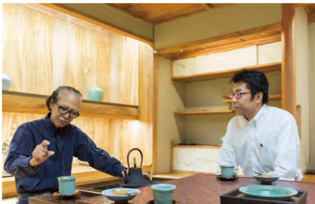
【写真】9月15日 弓野窯応接間で撮影

特に窯業関係の方には、古武雄の魅力を再発見してもらい、武雄に生まれた陶工としての誇りを持って欲しいですね。 最後に、武雄市の未来に一言お願いします。 〈中島〉 文化とは「化けること」と考えます。同じ材料に手を加えることで、いかに化けさせるかが重要です。やきものだけでなく、武雄の文化全体で豊富な個性を表現していくことが何より重要で、今後更に発展していくことを願います。