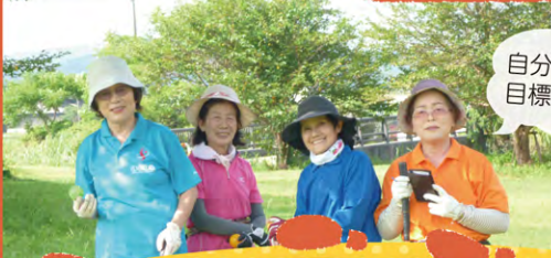
自分に合った目標をこなして