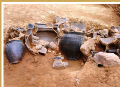
甕屋窯跡出土風景

その中の一つ、現在発掘調査中の東川登町甕屋窯跡についての発掘調査報告も「古武雄展」で一部展示予定です。ぜひご覧ください。