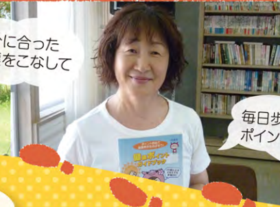
毎日歩いてポイントためました！