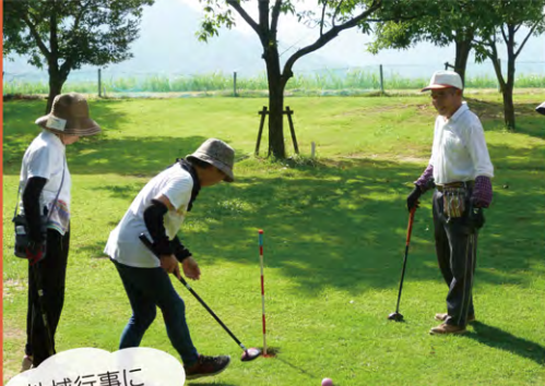
地域行事に参加したり