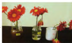
甕 ガラス 磁器

花を甕、ガラス、磁器に入れ10日ほど置くと、甕の中に入れて花が最も長く色あせる事なく咲いていたことが判明しました!