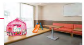
キッズルーム ガラス張りで見守る親も安心!