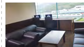
2階のロイヤル席(有料) 1部屋1日10,000円で借りれるBOX席など、ロイヤル席ならではの快適空間です。