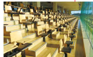
メインスタンド ガラス張り冷暖房完備。一般観客席179席(車いす席3席)があります!