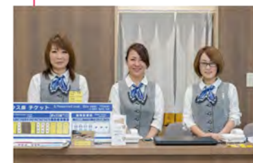
インフォメーション 女性のスタッフの方が優しく案内してくれます。買い方がわからない時も教えてくれます!