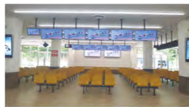
イベントステージ 開放感があり、イベントは大盛り上がり。