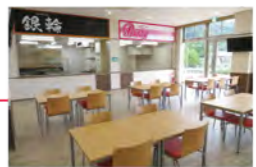
フードコート 2つの店舗が皆さんのお腹を満たします。"カツ"が付くメニューが多い。