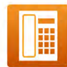
プラス電話(固定電話)

テレビ(基本チャンネル)およびインターネットと同時利用できない場合、初期費用3万円(税別)