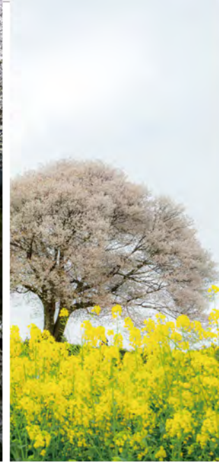
▲馬場の山桜(武内町)