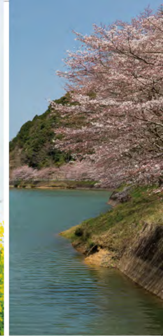
▲庭木ダム(西川登町)