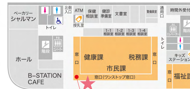
正面入口 総合案内(フロアガイド)