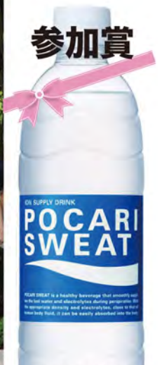
ごまめな水分と電解質補給で 熱中症対策! ポカリスエット ペットボトル 500ml