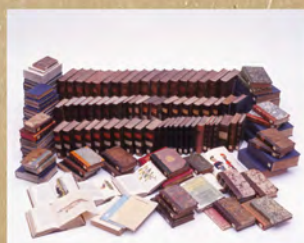
▲国重要文化財「武雄蘭書」 (武雄鍋島家資料 武雄市)