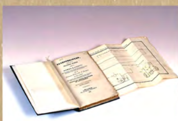
▲国重要文化財 ペキサンス著 『フランス海軍によるボンベカノン試射実験』 (武雄鍋島家資料 武雄市)