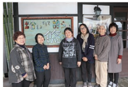
▲悠のメンバーの皆さん