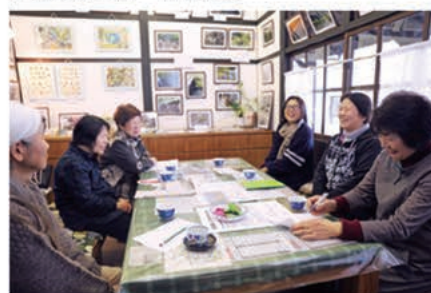
▲駅の一室を利用した交流の場