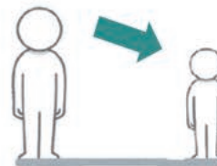
暴力のあるパートナーとの関係