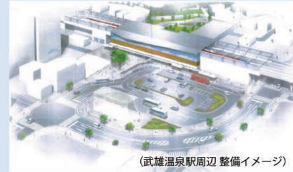
(武雄温泉駅周辺 整備イメージ)

九州新幹線西九州ルート(武雄温泉・長崎間)が2022年秋に暫定開業を迎えます。 新幹線の開業は、更なる人の交流により、地域や産業そして市民の生活が活性化する大きなチャンスとなります。 市全体で新幹線を活かしたまちを作っていきましょう。