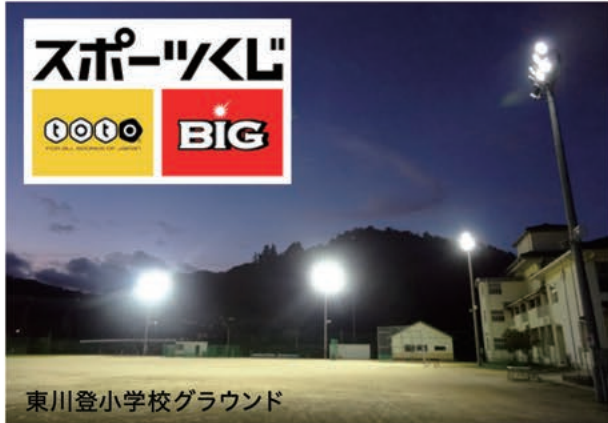
東川登小学校グラウンド