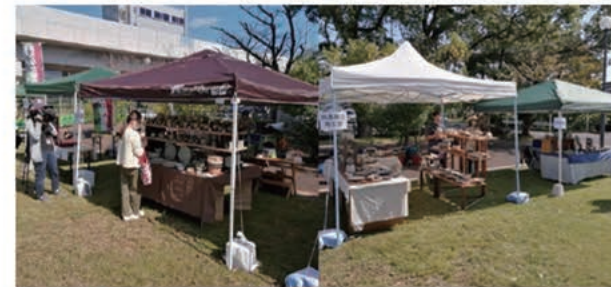
詳しくは 武雄市観光協会 ☎0954-23-7766