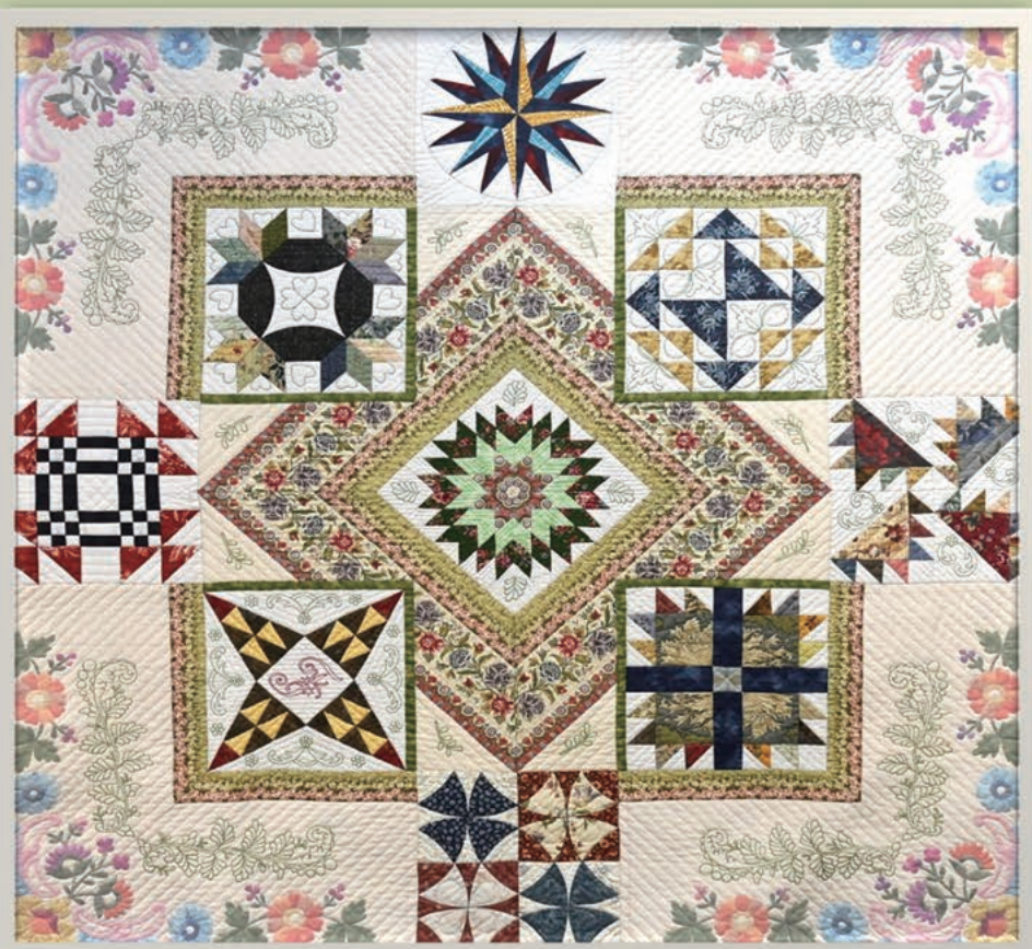
第40回武雄市公募美術展覧会 金賞作品「タペストリー」