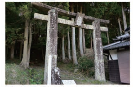
1 一の鳥居 大きくて立派な一の鳥居から登山開始!奥には早速石段が続いています。歩を進めると、住吉城跡のそばを通ります。