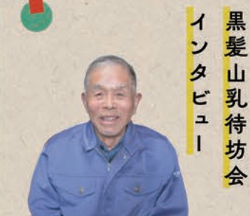
黒髪山乳待坊会 インタビュアー