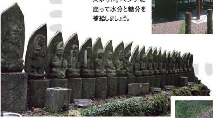
4 太鼓岩不動尊 不動寺の新四国八十八ヶ所には仏の道が続きます。