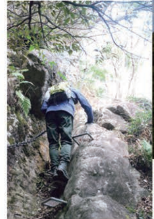
黒髪山DATA [標高]516メートル [登山所要時間]3時間