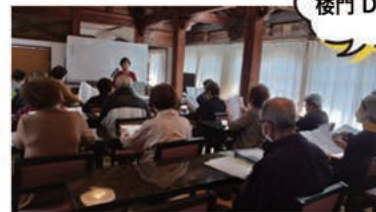
楼門 DE サロン

手や頭を使うことで、脳が適度に活性化され、記憶力維持や老化防止に役立つと言われています。