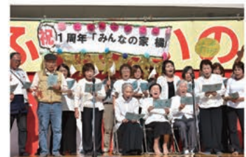
▲毎月第4金曜日は歌声サロンの日。 練習の成果を、橘町ふれあいまつりで披露しました。