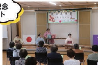
▲橘公民館で秋の演奏会。 感動的な琴の調べでした。