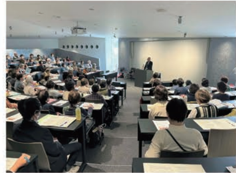
▲4/16 武雄市民大学が 301 教室で開講