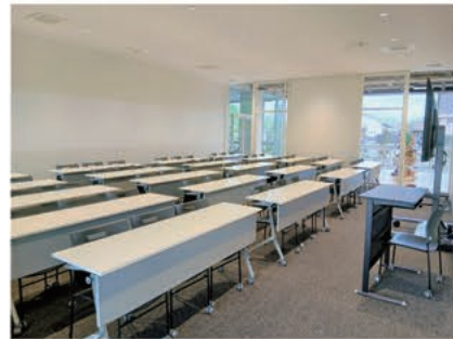
▲103 教室 (定員 60 名)