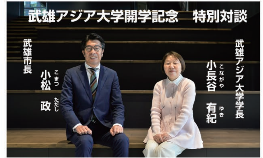
武雄アジア大学学長

市長 大学の開学おめでとうございませう。入学生の皆さんには武雄のまち全体に飛び出し、地域の皆さんと交流して、武雄を好きになってもらいたいと思います。 学長 武雄アジア大学の開学までの道のりを支えてくださりありがとうございます。この大学を自分たちで創り上げていきたいという強い思いがある学生たちが入学してくれました。