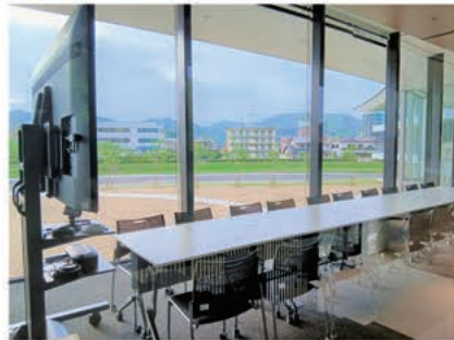
▲2 階多目的室 (定員 20 名)