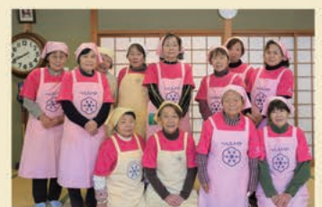
▲若木町食改推進員の皆さま

毎日の食卓は、私たちの身体を作り、心を育む大切な場所です。武雄市食生活改善推進協議会(食改)は食を通じた活動を行うボランティア団体です。各町の食改さんおすすめの美味しい常備菜レシピを紹介いたします。