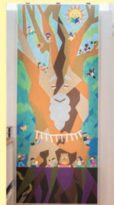
こども図書館の壁面アート

こども図書館の大きな壁面アートは、ノージーのひらめき工房のアートディレクションを担当する「tupera tupera」さんが手がけています。