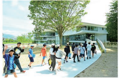
▲大学を見学する児童たち

5月8日、御船が丘小学校6年生が校外学習の一環として、武雄アジア大学を訪問しました。子どもたちは大学がどのような役割をもち、自分たちの学びや暮らしとどうつながっているのか、講義や大学生との交流を通して学びました。武雄アジア大学は『地域に開かれた大学』を目指して、市民の皆さまに大学キャンパスを開放し、市民講座を開催されるなど、地域との連携を進められています。