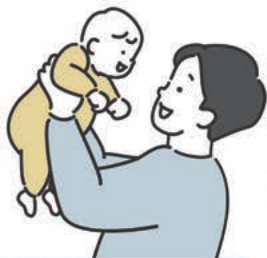
男性の育児休業取得率の推移