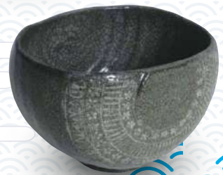
象嵌花文俵形茶碗

武雄市図書館・歴史資料館では、地元に伝わる歴史資料や武雄市にゆかりのある資料を収集・保管・活用しています。