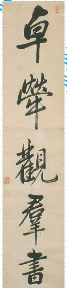
銅島直正書 銅島直正