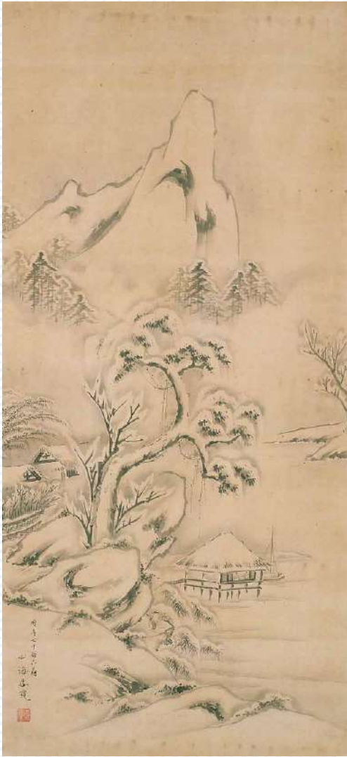
萩の尾茶屋雪景図 一広渡心海(良寛)