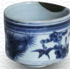
染付松竹梅文筒茶碗 百間窯