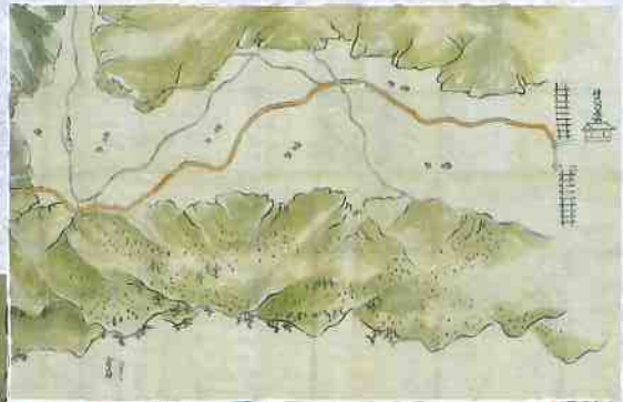
神六御番所之図より 神六御番所の部分

奇しくも、今年、日本最初の実測地図「大日本沿海輿地全図」を作製した伊能忠敬(1745～1818)の測量隊が武雄を測量してから200年目にあたります。郷土に対する興味や認識を深める一助として、その多くが初公開となる武雄に残された絵図の数々の展示を行います。