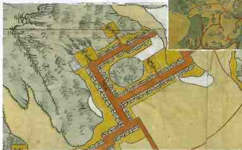
杵嶋郡並藤津郡武雄郷之図より武雄温泉の部分