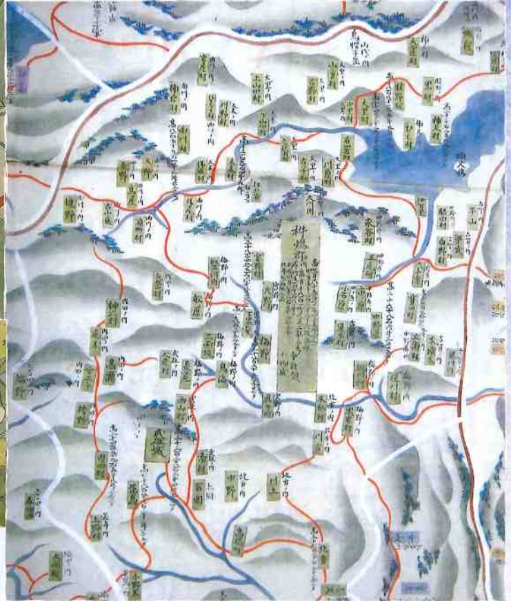
肥前全図より杵嶋郡の部分