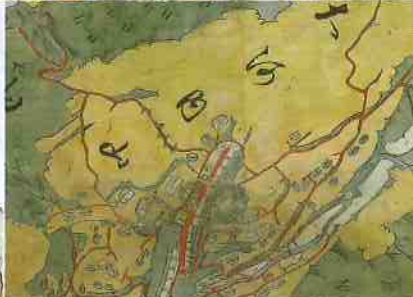
小田志村、庭木村之図より 登り窯の部分