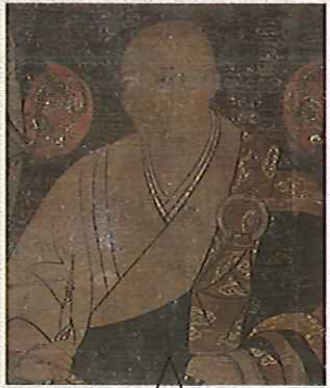
聖一国師頂相[部分](廣福寺)