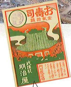
武雄駅 駅弁掛け紙(個人)