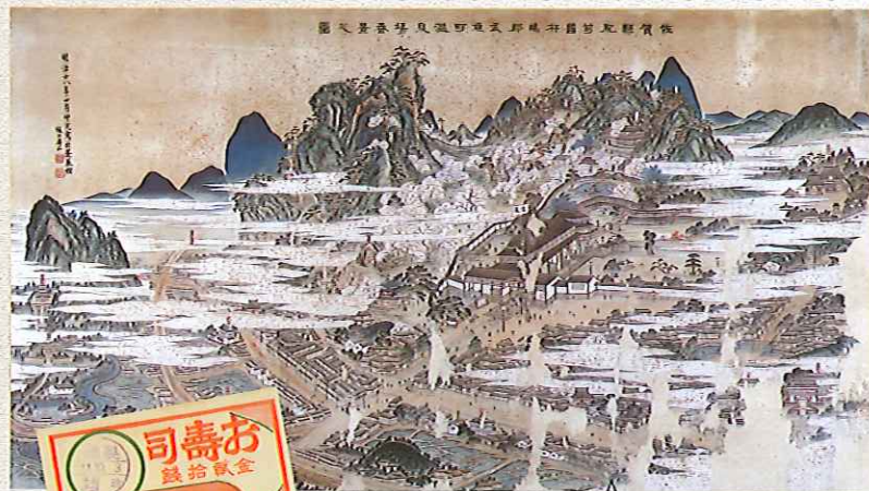
武雄温泉場春景之図(武雄温泉(株))