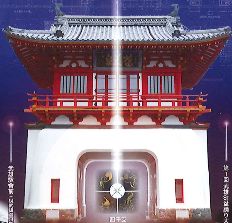
佐賀縣武雄温泉場建築図 (三樓門及賣店)