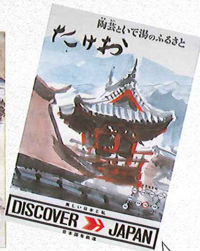
「たけお」ディスカバー・ジャパンポスター(武雄市)