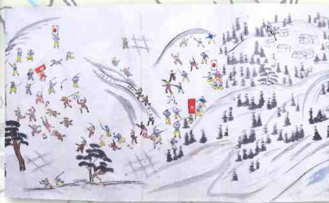
庄内戊辰戦争絵巻 鶴岡市立図書館(写真展示)