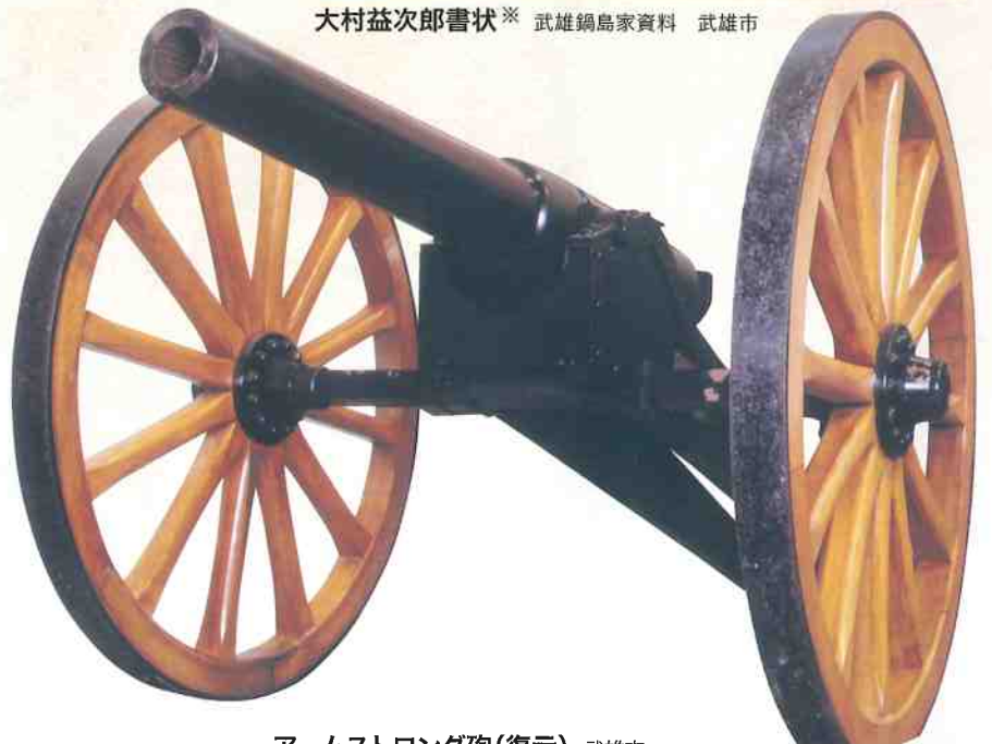
アームストロング砲(復元) 武雄市