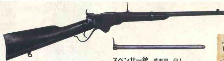
スペンサー銃 幕末期 個人