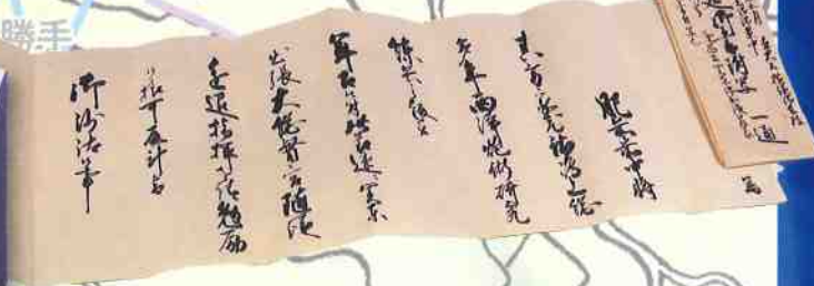
21-10 茂昌公関東御出張被蒙朝命候御書付写※ 武雄鍋島家資料 武雄市