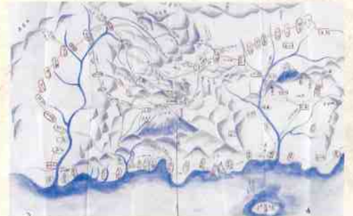
羽州御陣中諸所絵図 ※ 武雄鍋島家資料 武雄市