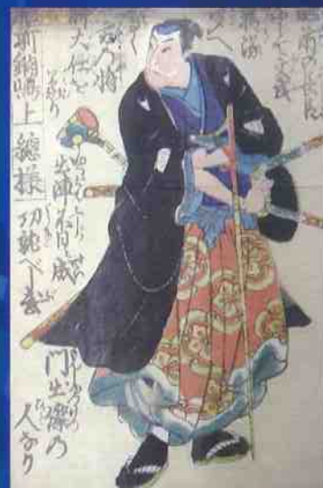
官軍忠勇千人之内(鍋島上総) 武雄市