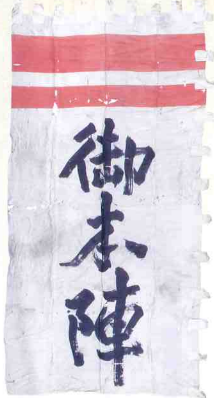
御本陣旗 ※ 武雄鍋島家資料 武雄市