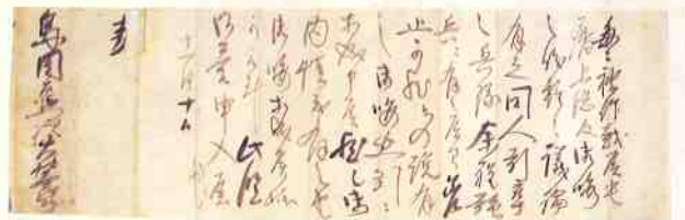
大村益次郎書状 ※ 武雄鍋島家資料 武雄市