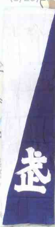
旗指物「家紋(抱銀杏)」 「武」※ 武雄鍋島家資料 武雄市