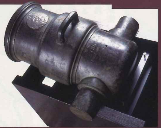
モルチール砲 武雄鍋島家資料 武雄市

また、河川交通も発達しており、武雄を東西に流れる六角川は、水害で人々を苦しめることもありましたが、水運によって人々の生活を潤しました。