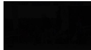
国体チャンネル (かごしま国体)