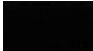
国体チャンネル (かごしま国体)