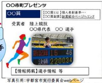
SAGA2024 実行委員会 第20回市町連絡会議資料抜粋