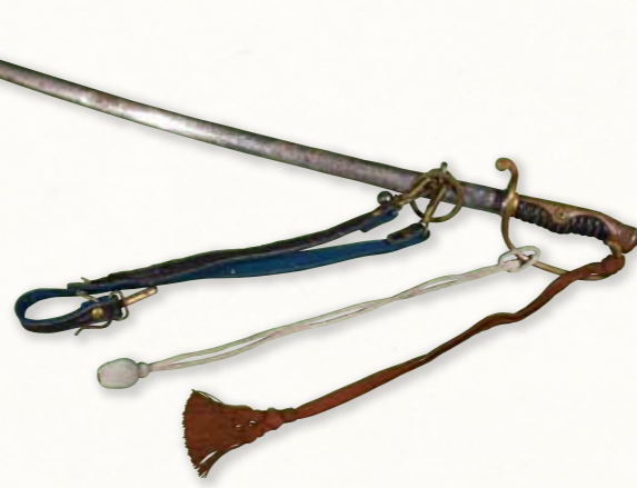
陸軍尉官指揮刀 [個人蔵]