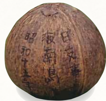
戦地から持ち帰ったヤシの実 [個人蔵]

日中戦争の長期化や、アメリカによる日本へのくず鉄・銅などの輸出制限などにより、資源の少ない日本は鉄や銅などの金属不足になりました。政府は、戦争に必要な金属を確保するため、金属類を政府に提供するように国民によびかけました。それでも不足したため、昭和16(1941)年に金属類回収令をだして、多くの金属類を回収しました。