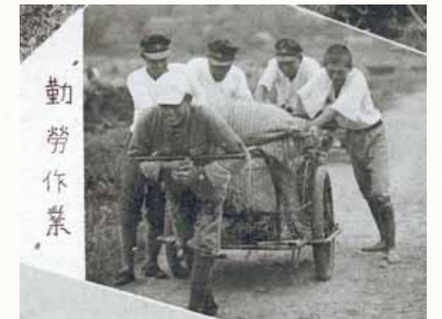
勤勞作業 (佐賀県立武雄中学校S18.3月発行)