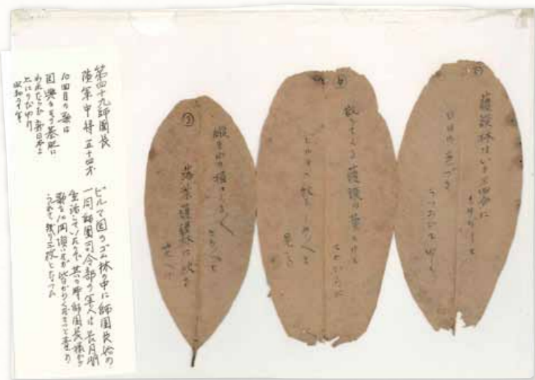
ゴムの葉(ビルマにて師団長書付の和歌) [個人蔵]