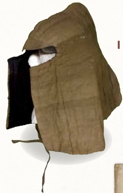
防空頭巾 [武雄市蔵]