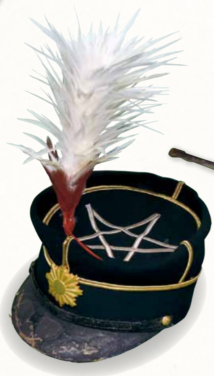
陸軍武官正帽 [個人蔵]