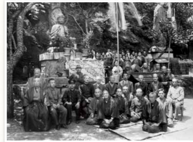
金属供出による回収前の薬師如来像(武雄町)

また、木造家屋が多い日本では、空襲により火災が発生し、大災害となることが予想されました。そのため、一般市民も防空活動を担い、各地で空襲に備えて防空演習が盛んにおこなわれました。昭和12年(1937)に防空法施行、戦況の逼迫に伴い改正されるなど防空施策が推進されましたが、実際の消火活動は主として原始的なバケツリレーに頼らざるを得ませんでした。