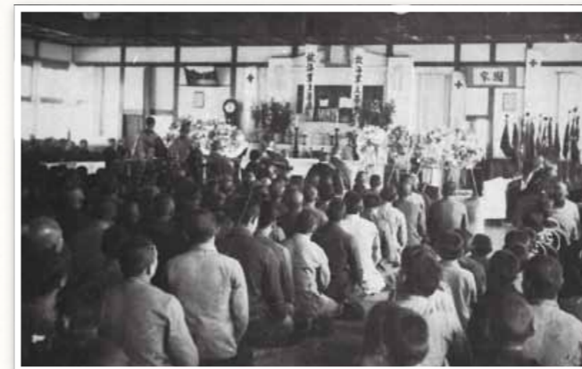
日中戦争戦死者の合同葬 [武雄市教育委員会]