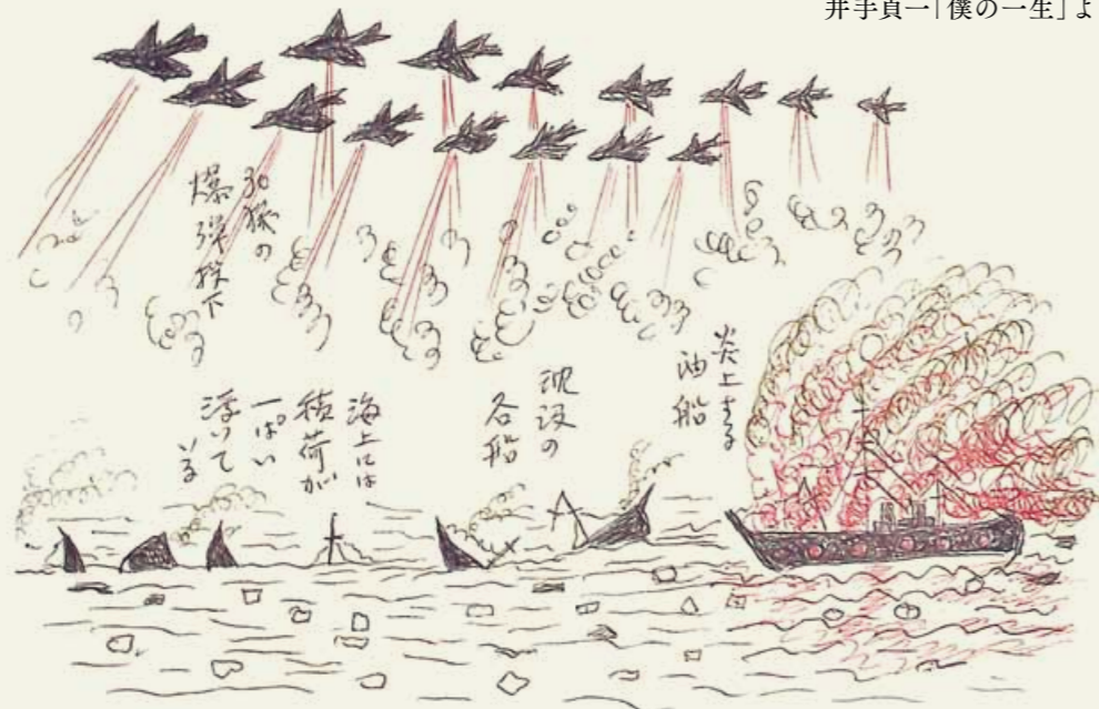
(イラスト) 爆撃を受け、炎上・沈没する船舶／井手貞一「僕の一生」より

魚雷が機関部をそれて他の部に当れば、船体は次第に荒波中に沈下してゆき、マゴ／＼ していると船体と共に吸い込れるので、一同は急いで荒波中に飛びこんで船体を逃ざか り、荒波にゆられながら救助船が来るまで赤いへびの泳ぐ中に、14時間—24時間—33時 間などそのまゝ、波にもまれ／＼て浮いていたが、救助船が来てワイヤーを投げ流しこれに つかまえられるが、長時間泳いで体力のない人は手を離して沈んでゆき、又やっとな乗船が 出来ても安心して船上で失命する人もあり、激沈でも半数人員は失つてしまつて残念であ つた。