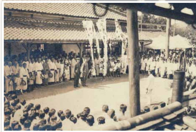
三間坂駅での出征式の様子

昭和6年(1931)に始まった満州事変や、昭和12年(1937)からの日中戦争により、日本と中国の戦争は泥沼化。中国を支援するアメリカやイギリスなどとの戦いへとつながっていきました。武雄からも召集令状を受け取った若者たちが戦地に向かいました。出征式の様子を写した写真や、千人針などからは、武雄と戦争との関わりが見えてきます。