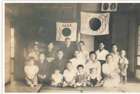
出征前の激励 家族集合写真