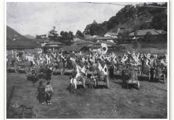
金属供出された梵鐘の告别式