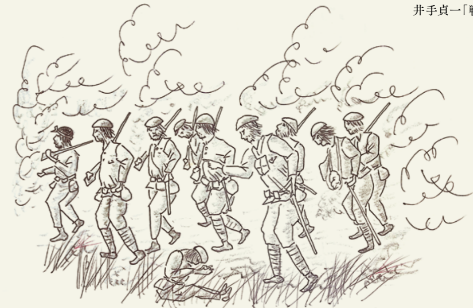
(イラスト) ビルマの戦いにて、総退却の様子／井手貞一「戦時物語」より