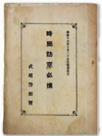
時局防空必携 [武雄市蔵]