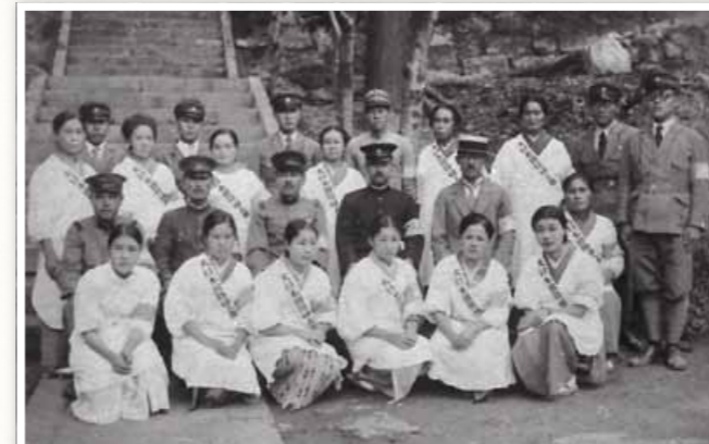
防護団による防空演習の記念写真(廣福護国禅寺階下)