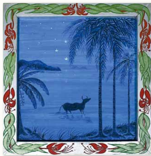
井手貞一「南十字星」 [個人蔵]