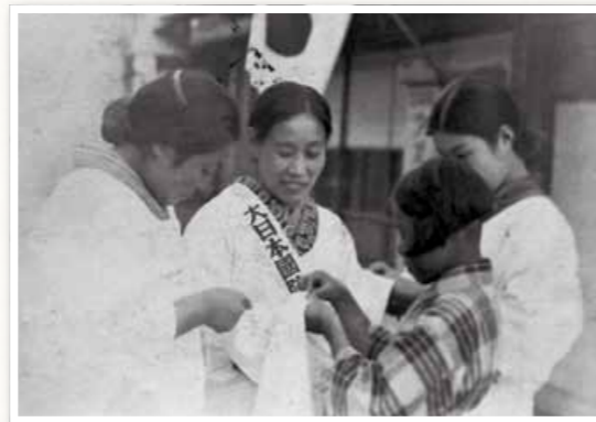
千人針の様子