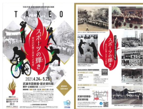
【企画展 スポーツの輝き

図書館・歴史資料館では、4月24日から5月23日まで企画展「スポーツの輝き～栄光の記憶と未来への希望～」を開催いたしました。5月9日に聖火リレー、7月に東京オリンピック、8月に東京パラリンピック、また、2024年には国民スポーツ大会が佐賀県で開催されます。武雄市をスポーツで盛り上げてい