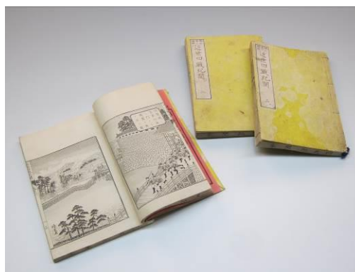
◀ 近世四戦紀聞（武雄市）